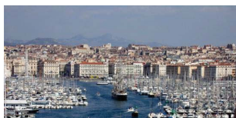
Vieux-Port vu du Palais du Pharo